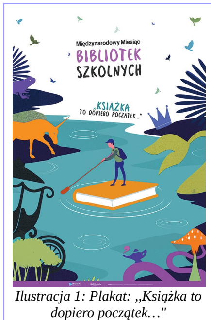
Ilustracja 1: Plakat: „Książka to dopiero początek...”

W 1971 roku powstało Międzynarodowe Stowarzyszenie Bibliotekarzy Szkolnych . Organizacja ta zajmuje się problemami bibliotek oraz bibliotekarzy szkolnych. I właśnie to Stowarzyszenie w 1999 roku zainicjowało Międzynarodowe Święto Bibliotek Szkolnych . Obchodzone jest w czwarty poniedziałek października. Celem akcji jest zwrócenie uwagi na ogromną rolę bibliotek w życiu szkoły, w nauce i rozwijaniu zainteresowań czytelniczych. Tegoroczne hasło obchodów brzmi „Książka to dopiero początek...”