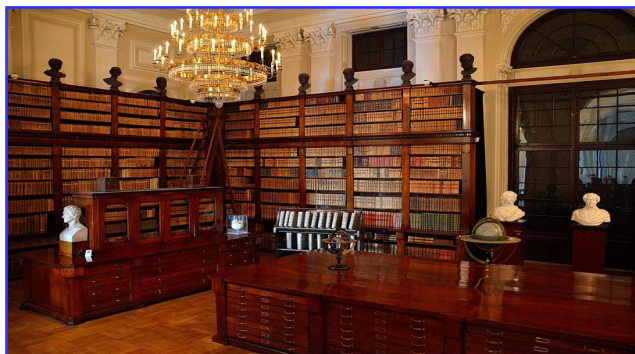
Ilustracja 2: Biblioteka Narodowa, zbiory specjalne

Bibliotekarz – pracownik biblioteki, pracownik zatrudniony zawodowo w bibliotekarstwie; tytuł i stanowisko w hierarchii służby bibliotecznej. Według przepisów unijnych (Dyrektywa 89/48), osoba zatrudniona jako bibliotekarz musi mieć ukończone co najmniej studia licencjackie z zakresu informacji naukowej i bibliotekoznawstwa.